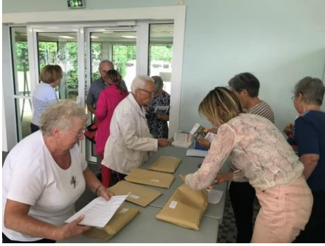
Empressements réciproques lors de la remise des livrets aux adhérents par l'équipe diocésaine.